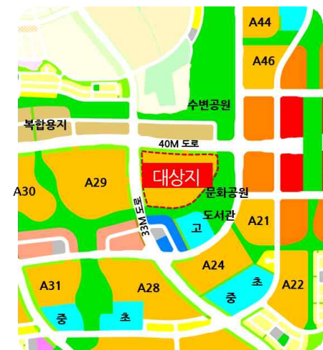
[미술작품 설치 “A, B” 위치도]