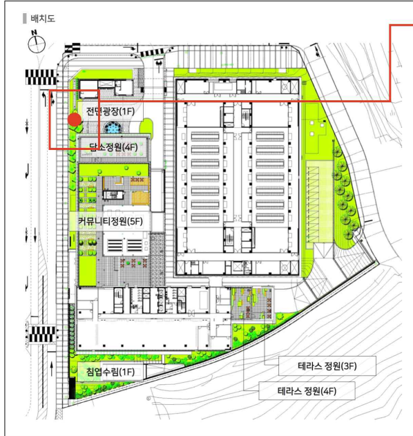
미술작품 위치 전면광장 앞 국기게양대 우측(정면기준)