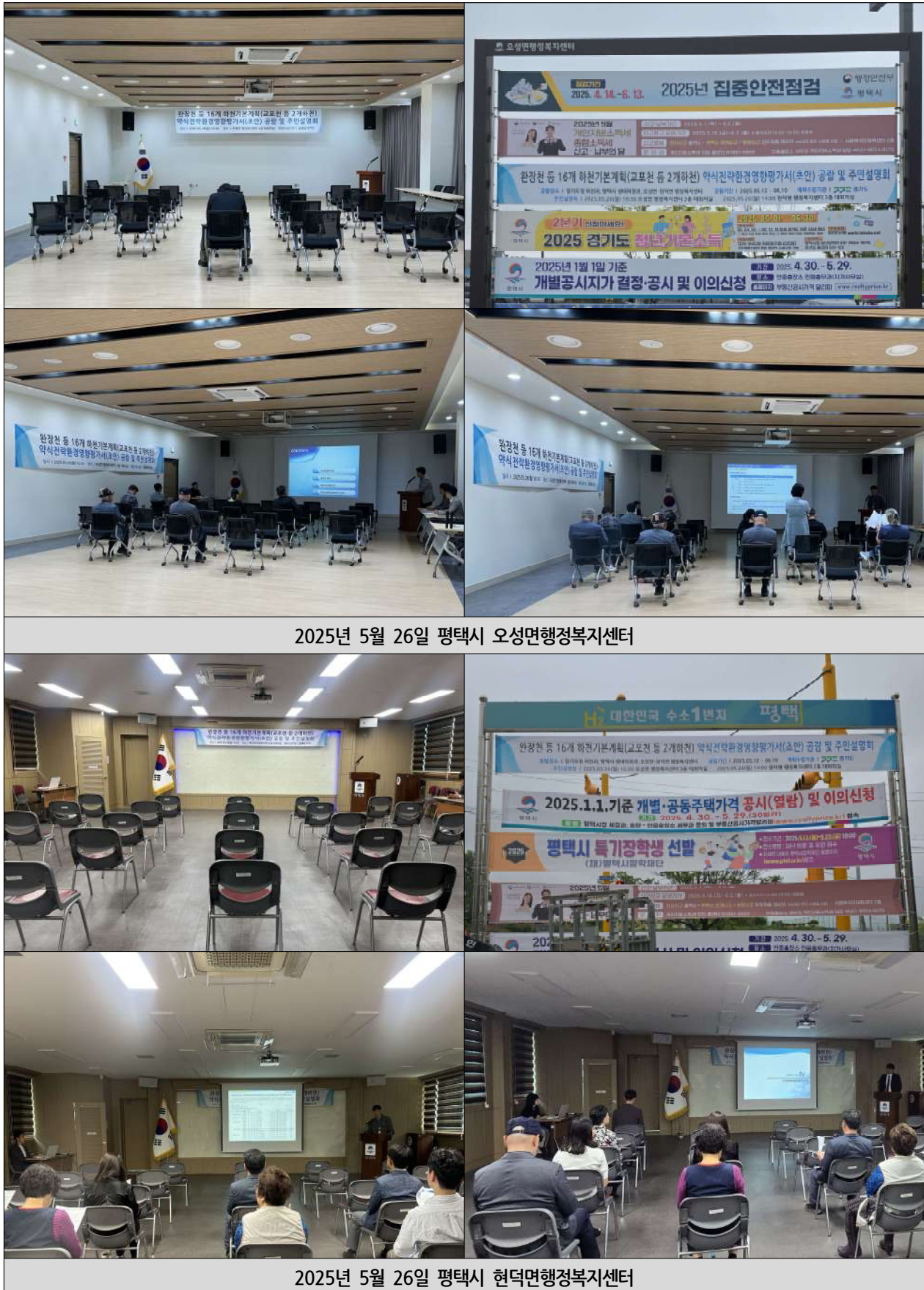
(그림 1.1-4) 주민설명회 개최 사진