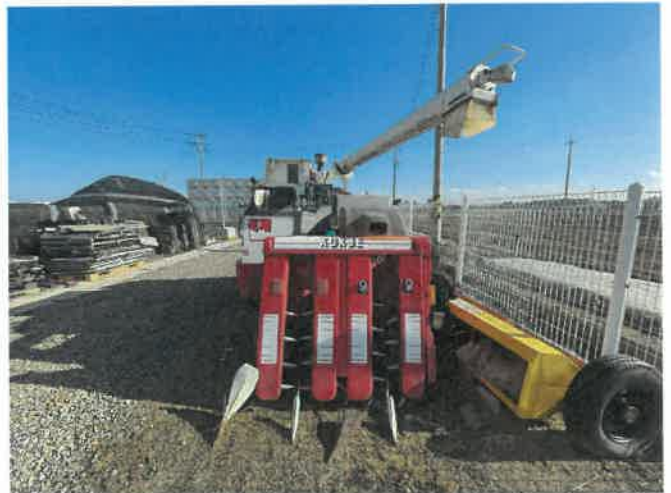
[ (43) 콤바인(평택분소) ]