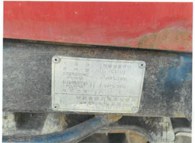
[ (43) 콤바인(평택분소) ]