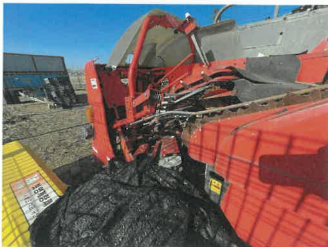
[ (43) 콤바인(평택분소) ]