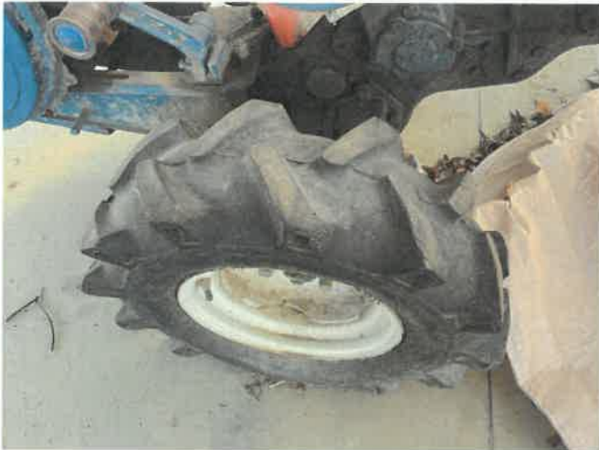
[ (46) 경운기(연천분소) ]