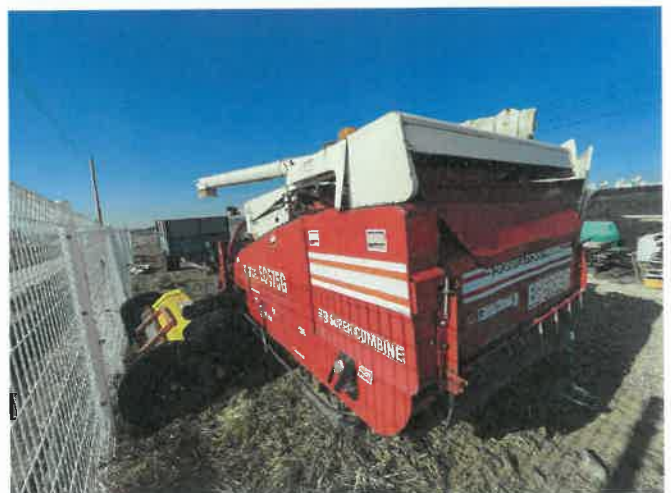
[ (43) 콤바인(평택분소) ]