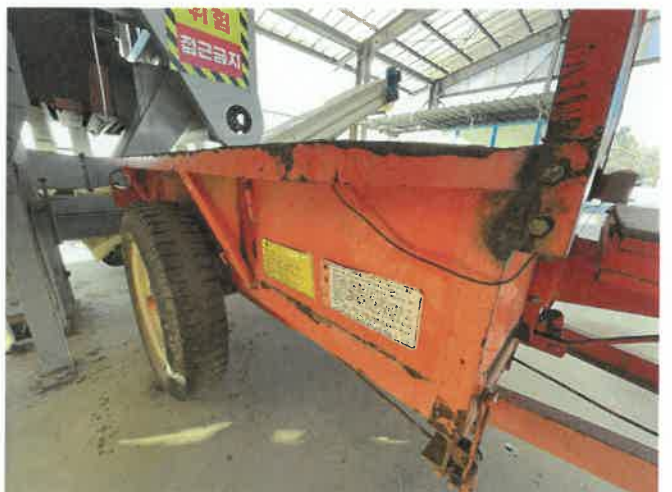
[ (47) 농업용트레일러(연천분소) ]