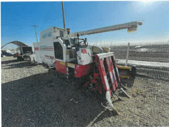
[ (43) 콤바인(평택분소) ]