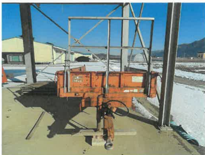
[ (48) 농업용트레일러(연천분소) ]