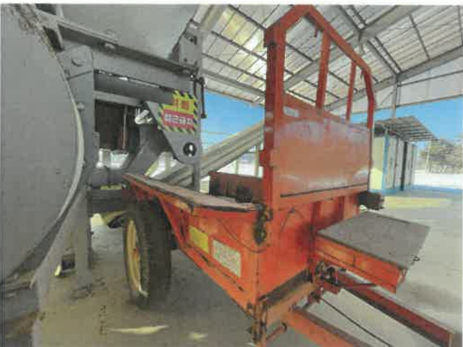
[ (47) 농업용트레일러(연천분소) ]