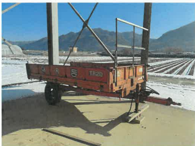
[ (48) 농업용트레일러(연천분소) ]