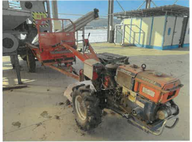
[ (46) 경운기, (47) 농업용트레일러 (연천분소) ] [ (46) 경운기, (47) 농업용트레일러 (연천분소) ]