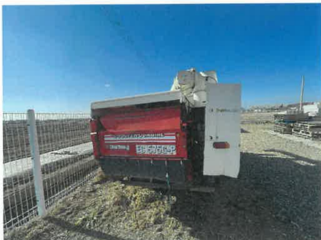
[ (43) 콤바인(평택분소) ]