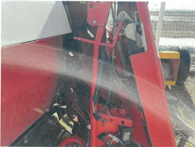
[ (43) 콤바인(평택분소) ]