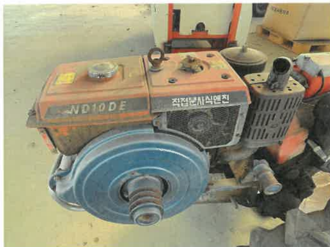
[ (46) 경운기(연천분소) ]