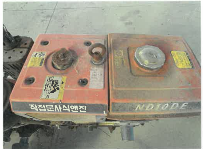
[ (46) 경운기(연천분소) ]