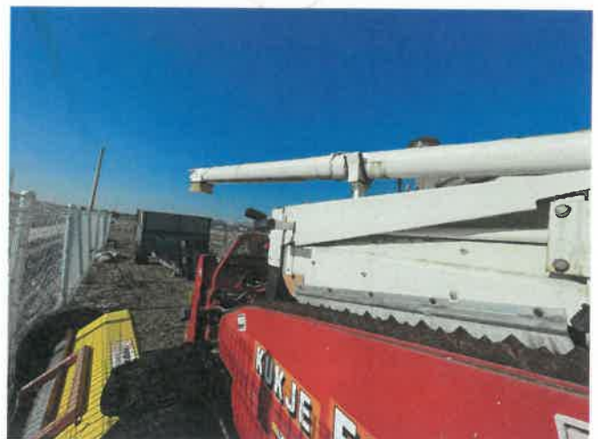
[ (43) 콤바인(평택분소) ]