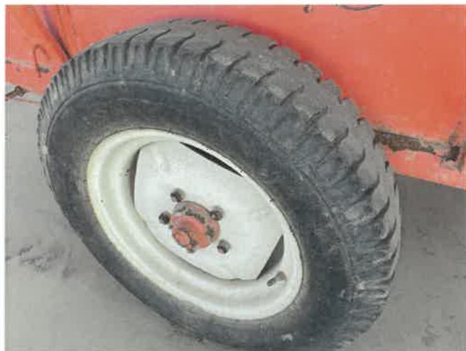
[ (47) 농업용트레일러(연천분소) ]