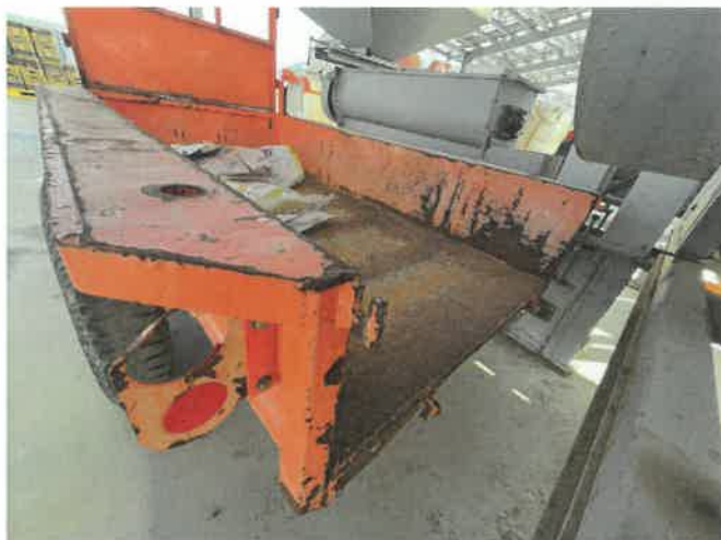
[ (47) 농업용트레일러(연천분소) ]