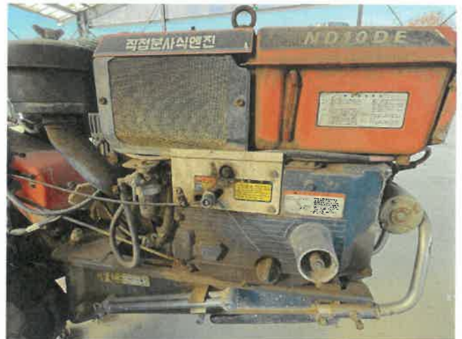
[ (46) 경운기(연천분소) ]