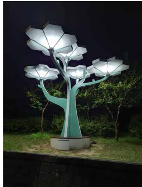
거창 상동마을 솔라트리