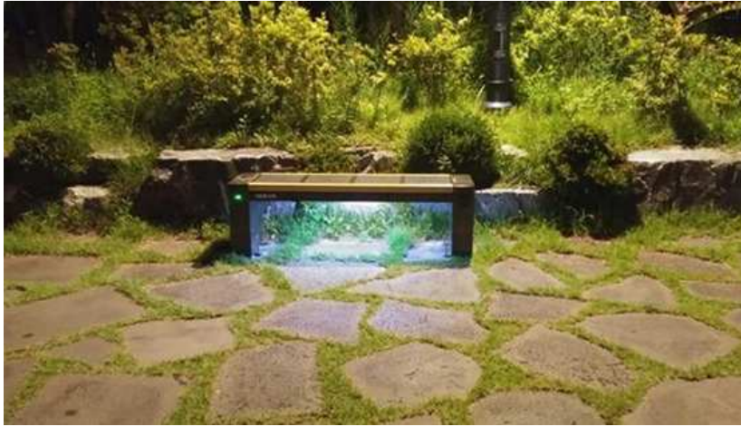
삼척시 공공장소 태양광 스마트 벤치