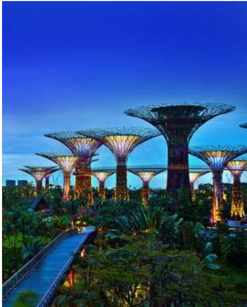
싱가포르 마리나 베이 솔라트리