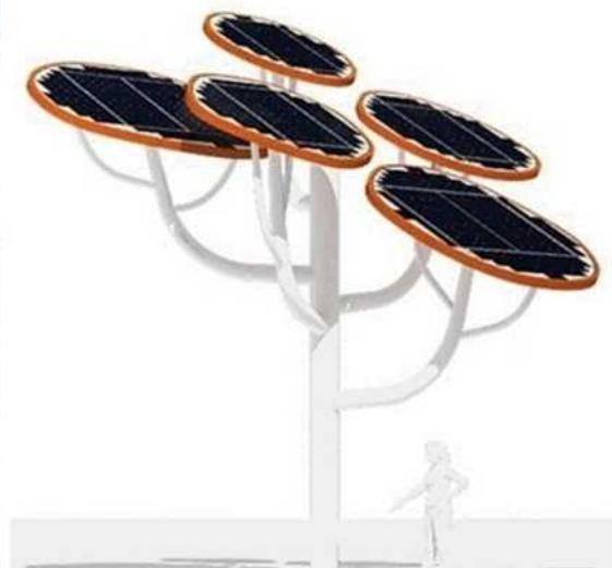
대전 서구 갤러리아 타임즈 솔라트리