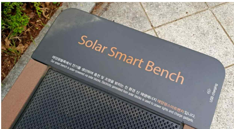
구로구 개명소공원 태양광 스마트 벤치