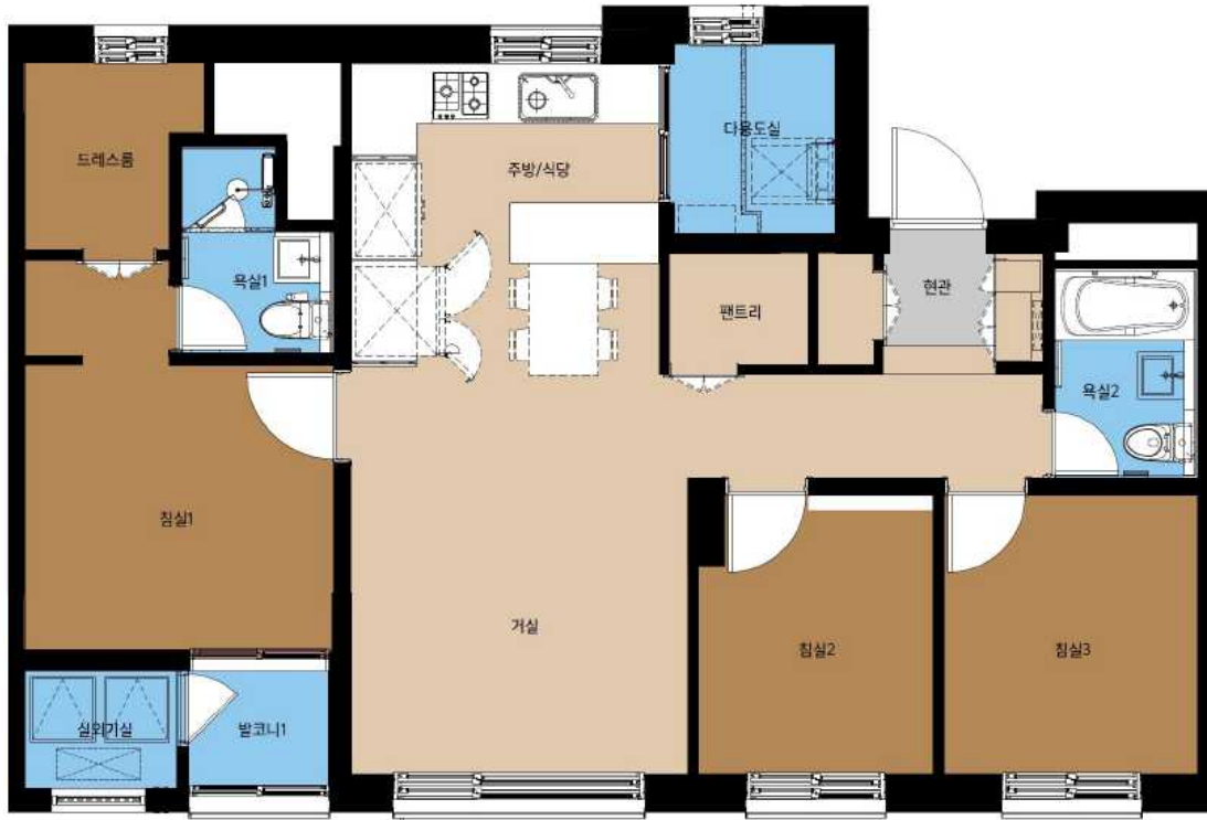
59A형 단위세대 평면도

※ 아래의 평면도는 이해를 돕기 위한 사전안내 자료이며, 설계변경 및 본 공고시 변경될 수 있습니다.