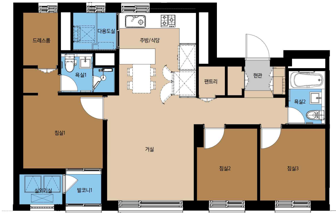
59B형 단위세대 평면도