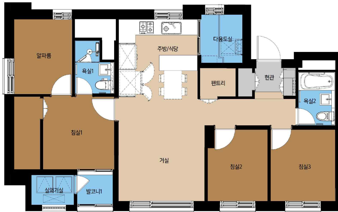
59C형 단위세대 평면도

※ 분양조건 및 분양일정문의 : LH경기지역본부 주택판매2부(031-250-8161) LH평택고덕 주택전시관(031-656-4995)