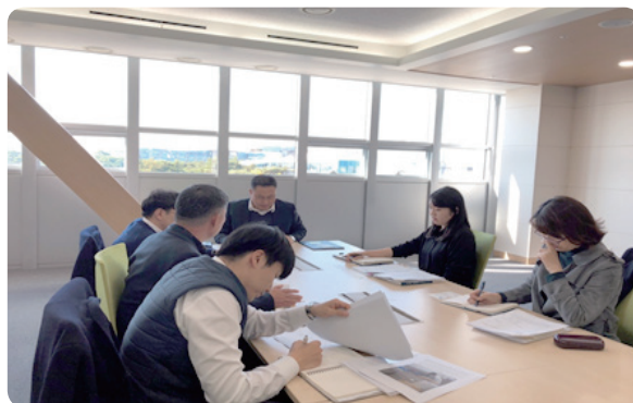
규제신문고과 환경부 회의 참석(2018. 10.)