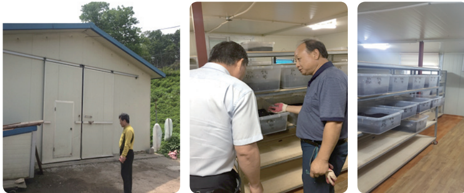
규제현장 및 곤충사육 농가 방문 (2018. 6.)