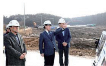
파주 CJ ENM 콘텐츠월드 현장 방문 중인 파주시청 관공서 직원과 파주시청 직원

(파주=연합뉴스) 노승혁 기자 = 경기도 파주시 탄현면 통일동산지구 특별계획구역에 조성되는 CJ ENM 콘텐츠월드 조성사업 1단계 사업이 당초 예정보다 2년 이른 내년 말 완공될 전망이다.